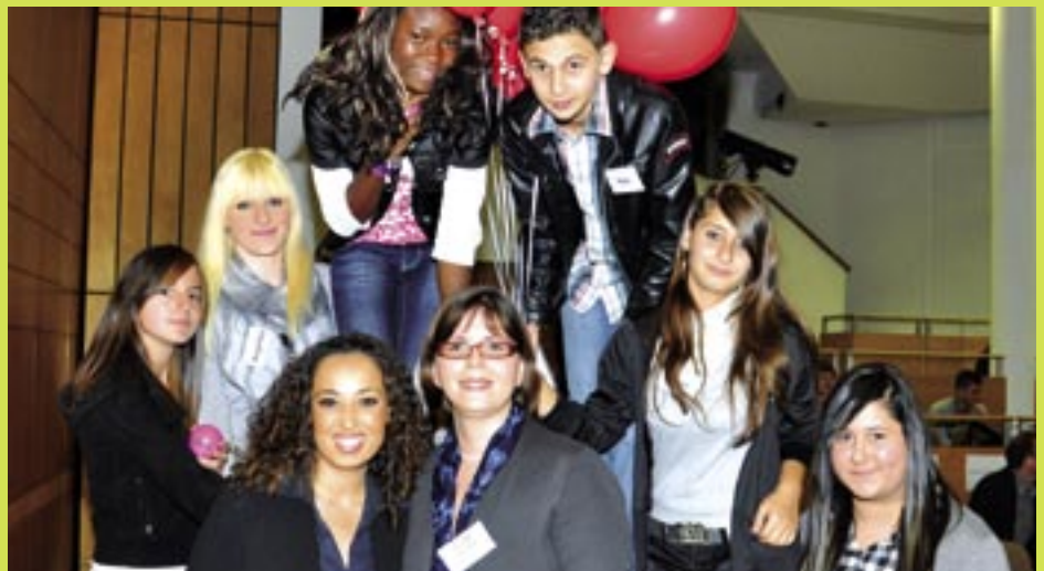
HP Pelzer fördert sechs Patenkindern

Somit konnten dreizehn Achtklässler in diesem Schuljahr im Projekt aufgenommen werden, vier Mädchen und sieben Jungen. Aktuell werden 52 Kinder durch 33 Unternehmen und Organisationen im Projekt gefördert.